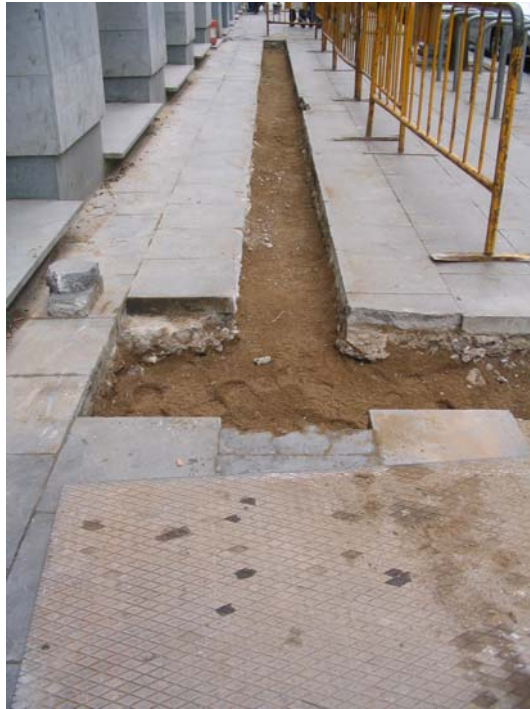
Fotografia núm. 3: Rasa 100 un cop coberta