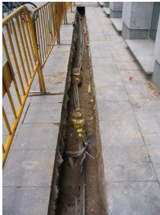
Fotografia núm. 2: Rasa 100