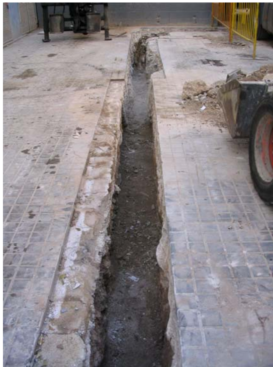
Fotografia núm. 4: Rasa 200