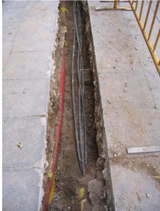
Fotografia núm. 1: rasa 100