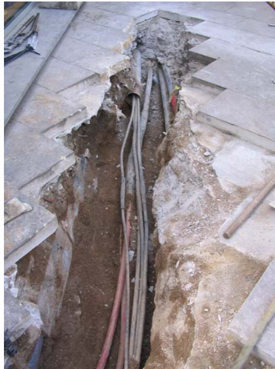
Fotografia núm. 5: Rasa 300